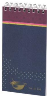
Notes to do list