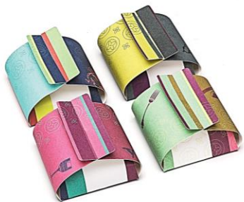
Set di quattro scatoline per piccoli cadeaux per gli ospiti o porta bon bon